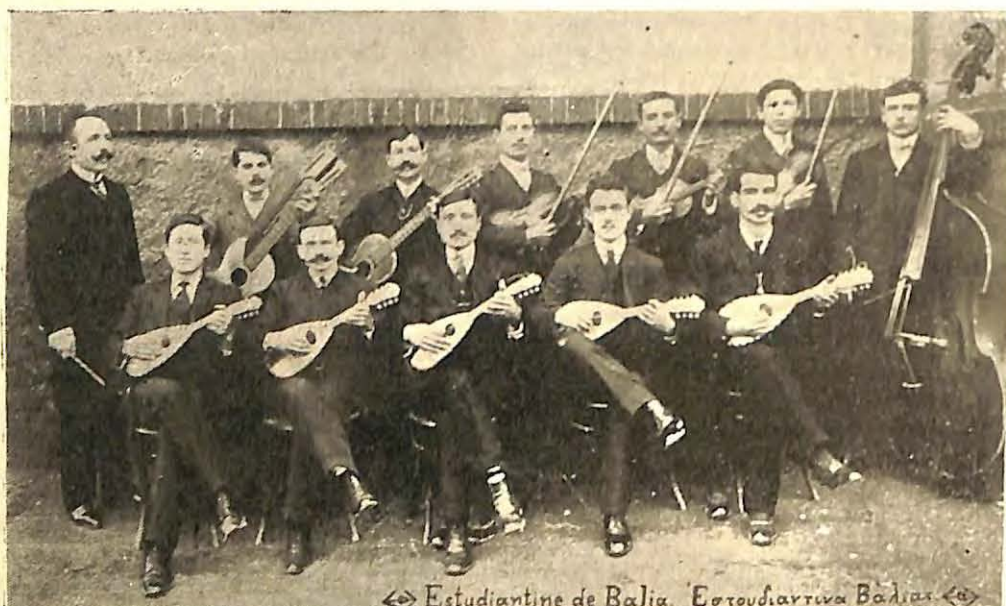
Estudiantine de Balia. Ἐσπουδιαντινα Βαλίας

Ἄνω *Ὁ ὑπὸ τῶν μαθητῶν τοῦ ἐν Σμύρῃ Ἀμερικανικοῦ Κολλεγίου ἀποτελούμενος ἑλληνικὸς φιλολογικὸς σύλλογος «Ὀμηρος» ἔδωκεν ἐπιτυχὴ ἡμερίδα, καθ' ἣν ἐδιδάχθη ἀπὸ σκηνῆς ἡ τραγωδία τοῦ Εὐριπίδου «Ἰππόλυτος». Τὰ πρόσωπα τοῦ δράματος ὑπεδύθησαν μαθηταὶ καὶ μαθήτριά τῆς σχολῆς, οἵτινες καὶ ἀπέδωκαν τὰ μέρη τῶν ἀρ-