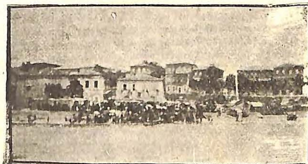
Η ΚΑΤΑ ΤΗΝ ΑΠΟΒΙΒΑΣΙΝ ΥΠΟΔΟΧΗ ΤΩΝ ΕΚΔΡΟΜΕΩΝ.

σε, προσεῖλκυσε καὶ ἡμᾶς διὰ νὰ ἐπισκεφθῶμεν ἐκ τοῦ πλησίον τὰ Ἀρχιγένεια καθιδρύματα, ἐν οἷς καὶ ἡ μουσική, ἢ τε ἐκκλησιαστικὴ καὶ ἡ λοιπὴ σχολικὴ, κατὰ ρητὴν τῶν ἀειμνήστων αὐτῶν εὐεργετῶν καὶ ἰδρυτῶν ἐπιθυμίαν, διδάσκειται ἐν εὐρυτάτῳ βαθμῷ ὑποχρεωτικῶς. Ἄλλ' ἐκτὸς τῆς τετραῶρου καὶ πενταῶρου ὑποχρεωτικῆς διδα-